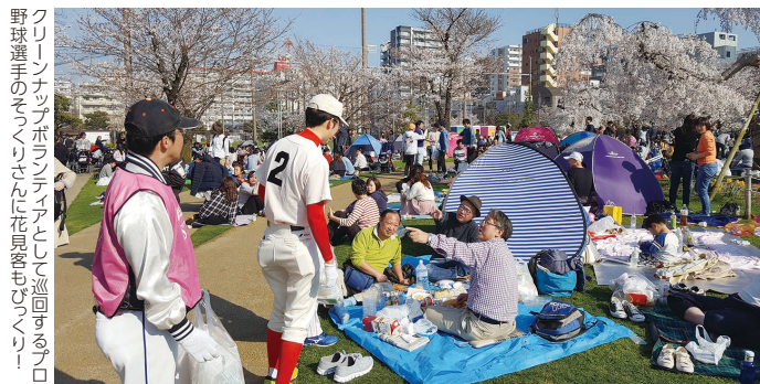
野球場選手のサインボードとして巡回するプロクリンナップボックス

「錦糸公園桜まつり」(3月24日～4月15日、主催:錦糸公園桜まつり実行委員会)は皆様のご協力のもと無事に開催終了しました。今回も多くの方がお花見に訪れて大盛況となりました。運営協力および協賛いただいた方々に心より御礼申し上げます。