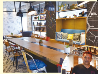
USB接続もできる ライブラリのテーブル

【ホテル モクシー東京錦糸町】 墨田区江東橋3-4-2 ☎03-5624-8801