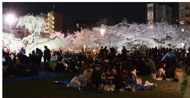
大盛況 ライトアップした桜が盛り上げ夜のお花見も