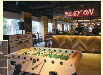
バーカウンターやテーブルゲームなども置かれたラウンジ