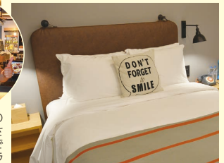
シモンズ製ベッドが使われている